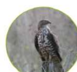
La Bonbrée apivore