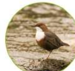
Le cincle plongeur

Ce site abrite de nombreuses autres espèces sauvages: