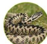
La vipère péliade