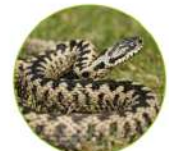
La vipère péliade