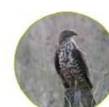
La bondrée apivore

For fishing activities, you must have an angling license ( www.cartedepêche.fr ).