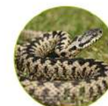
La vipère peliade