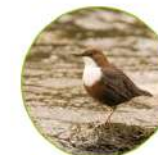
Le cincle plongeur