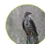
La Bontrée apivore

For fishing activities, you must have an angling license ( www.cartedepeche.fr ).