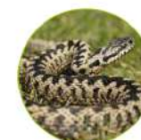
La vipère péliade