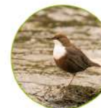
Le cincle plongeur