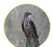
La Bondrée apivore