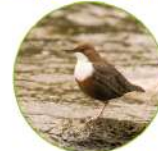
La cinclé plongeur

Ce site abrite de nombreuses autres espèces sauvages: